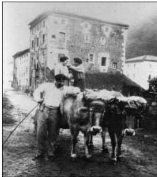
Abereak behar-beharrezkoak ziren etxeko lanak egiteko.

Igandea edo jai eguna noiz iritsiko zain egoten zen jendea. Jai eguna izan arren, baserri-tarrak betiko orduan jaikitzen ziren. Kortako lanak egin eta arropak aldatu ondoren, auzoko ermitara joaten ziren, mezatarara. Meza ostean, gizon koadrilak batzen ziren, lagunartean, hamarretakoa egiteko. Tertulia egiten zuten, astean zehar auzoan zer gertatu zen elkarri kon-