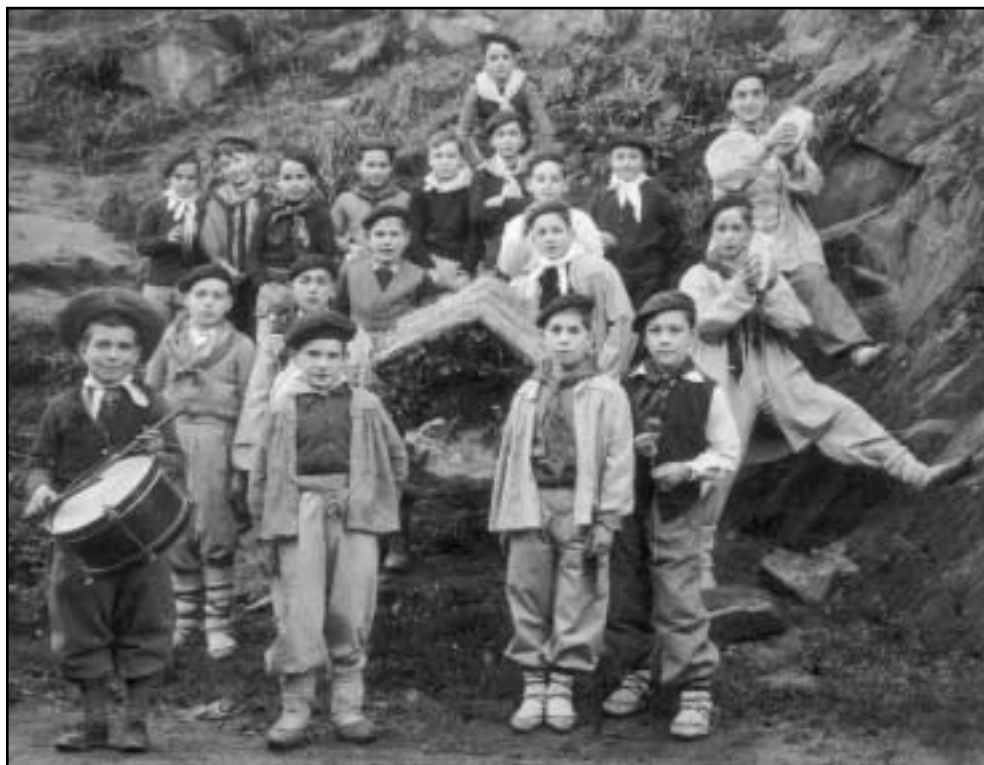
Pilar ikastetxeko ikasleak, eskolako Jaiotzaren ondoan. Gutxi gorabehera 1949 urtea.

Baserri auzoetako umeen eguneroko bizimoduak ez zuen zerikusirik kalean bizi ziren umeenarekin. Izan ere, baserrietan beti lan handia egoten zen, eta horregatik, baserrietarren seme-alabak txiki txikitatik hasi behar izaten ziren baserriko lanetan. Hasieran, lan txikiak eta mandatuak egiten zituzten, baina handik denbora gutxira, baserriko lanei heldu behar izaten zieten. Horiek horrela, argi ikus daiteke baserriko umeek adin bereko kaleko umeek baino denbora gutxiago izaten zutela jolaserako.