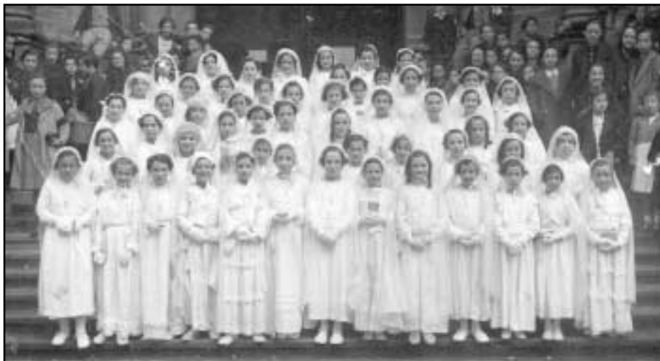
Lehenengo Jaunartzearen eguna oso berezia izaten zen gure aiton-amonentzat.

Eta haien oroimenetik hainbat gauza desagertu badira ere, beste hainbat gauza ondo gogoan dituzte. Egia esan, inori ere ez zaio ahaztu jaunartze egunean zer nolako jantziak eraman zituzten.