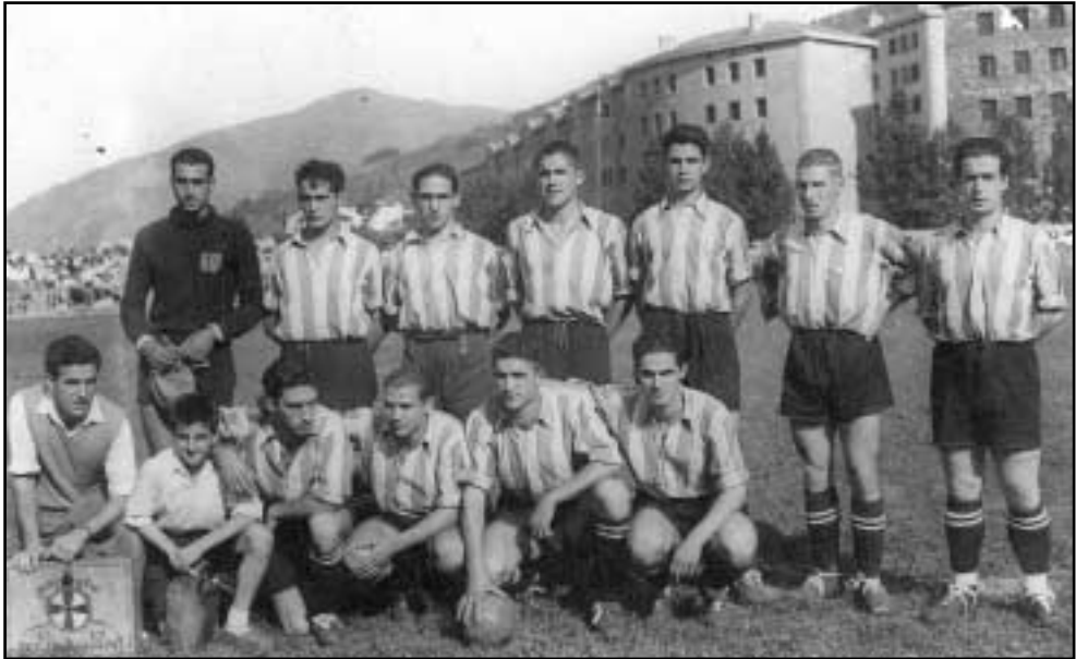
Eibarko Ipurua futbol zelaia inauguratu zeneko partiduan, Elgoibarko Klub Deportiboak aurkeztu zuen hamai-kako titularra. 1947 urteko azaroaren 14a.

Edonola ere, joan den mendearen erdialdera arte, kirol jarduerak ez ziren elgoibartarren artean zabaldu, ez behinik behin, taldean egiten zirenak. Dena dela, bada salbuespen bat: futbola. Kirol jarduera honek mende hasieratik izan baitzuen jarraitzaile ugari.