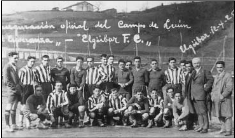
Desagertutako Lerun futbol zelaiaren inaugurazio ofiziala. 1925eko apirilaren 12a.

Eta atal hau bukatzeko, berriz ere, elgoibartarrik gehien batzen zituen kirola aipatuko dugu: futbola. Aurreko paragrafoetan aipatu dugun legez, futbola eta pilota-jokoak ziren gure nagusien artean estimaziorik handiena zutenak, hala partaideei nola jarraitzaileei zegokienean.