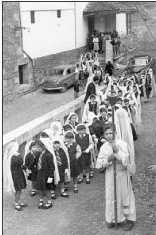
Santa Klarako eskolaren inaugurazioa.

naukalako. Orduan amamak zakazen seme-alabak Argentinan, eta harek noizian behiñ pakete bat bidaltzen zeber bar-kuan erropaz beteta, eta erropa horrek guk ibiltzen genduzen. Eta amamak erro-pia ekarri, probau eta haretzek jantzitta jun nintzan ni Elkano ikustera. Oso pozik gogoratzen det nik egun hori. Ni ez nitzan gauza askotan fijau baiña hara jutiakin nahikua zan, eta Elkanoren estatua nola ikusi naban oso ondo gogoratzen naiz.”