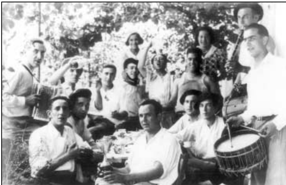
San Antolineko gazteak, herriko jaietan, bazkari bat egin ondoren. 1935 urteko iraila.

Hala ere, harreman baten oinarriak jarri bezain laster, hasten ziren nerabeen zalantzak: harreman bati ekiteko unea al da? Nire bikote ideala ote da? Oso ohikoa zen gure aitona-amonak euren buruei tankera horretako galderak egitea. Zalantza hauetaz gain, beste batzuk ere izaten zituzten, norberaren interesei zegozkienak, hain zuzen. Honekin, bikotekideen bizilekuari egin nahi diogu erreferentzia. Kontuan izan behar dugu, duela 8 edo 9 hamarkada, oso aukera gutxi zegoela leku batetik bestera joateko. Oso asti gutxi izateaz gain, garai hartako elgoibartarrek ez zuten ez autorik, ez autobusik eskueran, eta askotan, bizikletarik ere ez. Horrela bada, ez da harritzekoa 7 kilometrora edo urrutiago bizi zen pertsona batekin harremanetan jartzerakoan, zalantzak izatea. Izan ere, elkarrekin egon ondoren, mutilak lagundu egin behar izaten zion neskari etxeraino. Horri "neska laguntzia" esaten zioten.