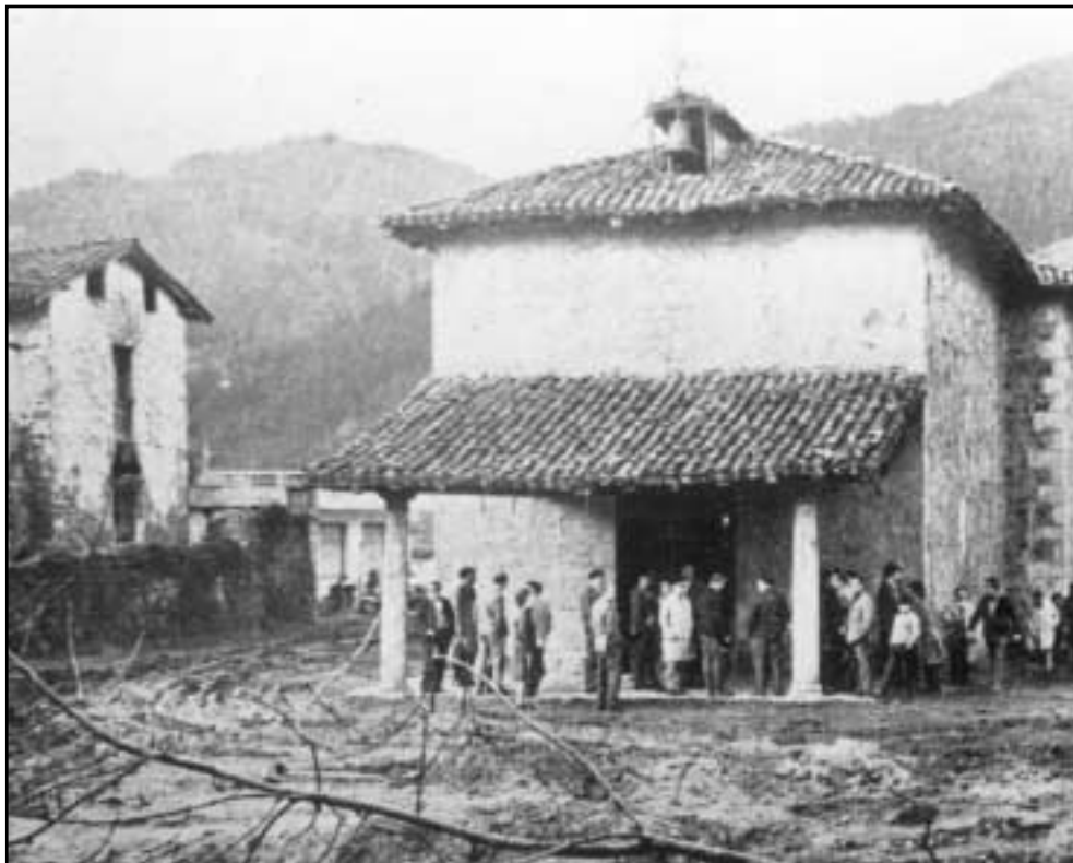
San Antolin basiliza auzotarren biltokirik garrantzitsuena izan zen. 1972an bota egin zuten, autobidea egiteko.

Baserritar gehienak, bestalde, auzoko basilizan egiten ziren elizkizunetara joan ohi ziren.