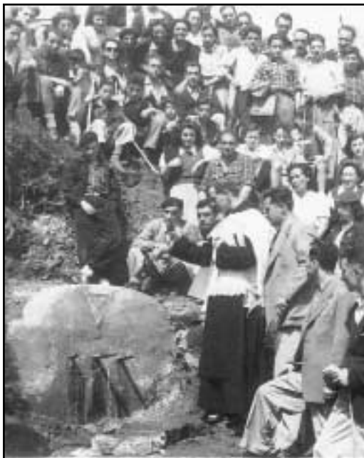
Hiru-Iturriko iturriaren inaugurazioa. 1948 urtea.