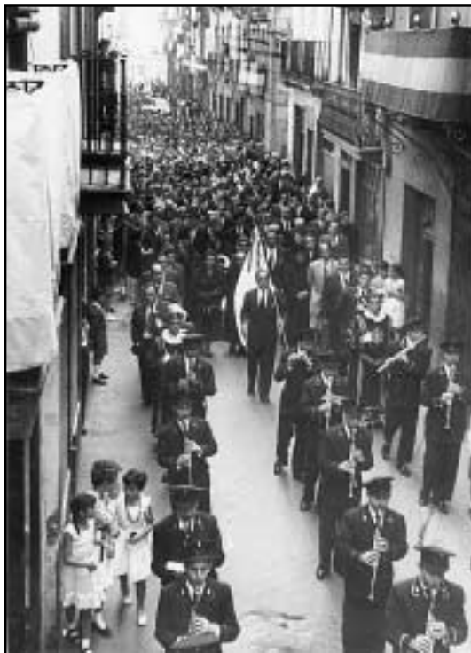
Gure herriko kale nagusiak jendez betetzen ziren Musika Bandaren ekitaldiak ikusteko.

merietan. Horrela bada, oso ohikoa zen Azkoitiko eta Azpeitiko gazte koadrilak gure herriko auzo-erromerietara etortzea, batez ere, Sallobente-Ermuaran auzokorra. Eta hori aipagarria da, sasoi hartan, alde batetik bestera oinez joan behar zutela kontuan izaten badugu. Eta garai hartan, erreperiderik ez zegoenez, bide eta bidezidorretatik joan behar izaten zuten mendian barrena.