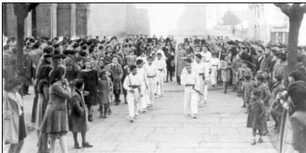
Gure herriko jaietan betidanik egin izan dira dantzarien eta dultzaineroen ekitaldiak.

Joan zen mendearan lehenengo erdialdean, gure herriko jai nagusiek hiru egun irauten zuten: San Bartolome eguna, San Bartolome txiki eguna eta hurrengo eguna.