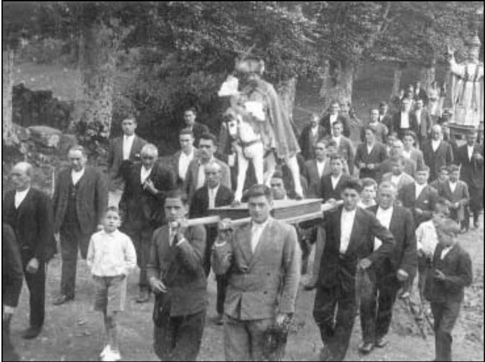
Idorbeke (San Pedro) auzotarrek, urtero, prozesioa egiten dute santuaren ohoretan. Prozesio hau San Pedro egunean ospatzen da.

Umeren bat bataiatzen zutenean ere ospakizunak egiten zituzten gure nagusiek. Gehienetan, familiak etxean biltzen ziren bazkari berezitzoren bat egiteko. Horrek ez du inolako zerikusirik gaur egungo ospakizunekin. Sasoi hartan aita eta ama besoetakoak, aiton-amonak eta seniderik hurbilenak bakarrik joaten ziren bataio-bazkarira.