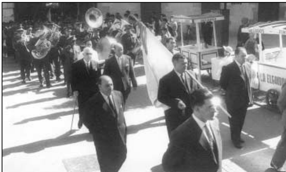
Udal agintarien desfilea, banda militar bat atzetik dutela. 1958 urteko San Bartolome eguna.

Etxeko animalien patroï den San Antonio abadearen eguna, hau da, San Anton eguna ere ospatzen zuten elgoibartarrek. Neurri txikiagoan bada ere, gaur egun ere ospatzen da egun hori. Izan ere, urtarilaren 17a gure herriko bigarren patroïaren eguna zen. 1665 urtetik hona, egun hori berezia izan da gure herritarren jai egutegian. Dena dela, gure aiton-amonek ez dute egun hura bereziki gogoratzen. Egund hartan ez zen aparteko gauzarik egoten. Inoiz, sokamuturraren edo feriaren bat egun izan zen, baina elgoibartar gehienentzat “egun hura ia-ia gainontzekoak bezalakoa izaten zen”. Meza Nagusia eta Udal Musika Bandaren kontzertua izan dira aspalditik egun horretako ekitaldirik garrantzitsuenak. Bestalde, badi-rudi, elgoibartarrek, joan den mendearen hasieran, San Anton eguna ospatzeari utzi ziotela.