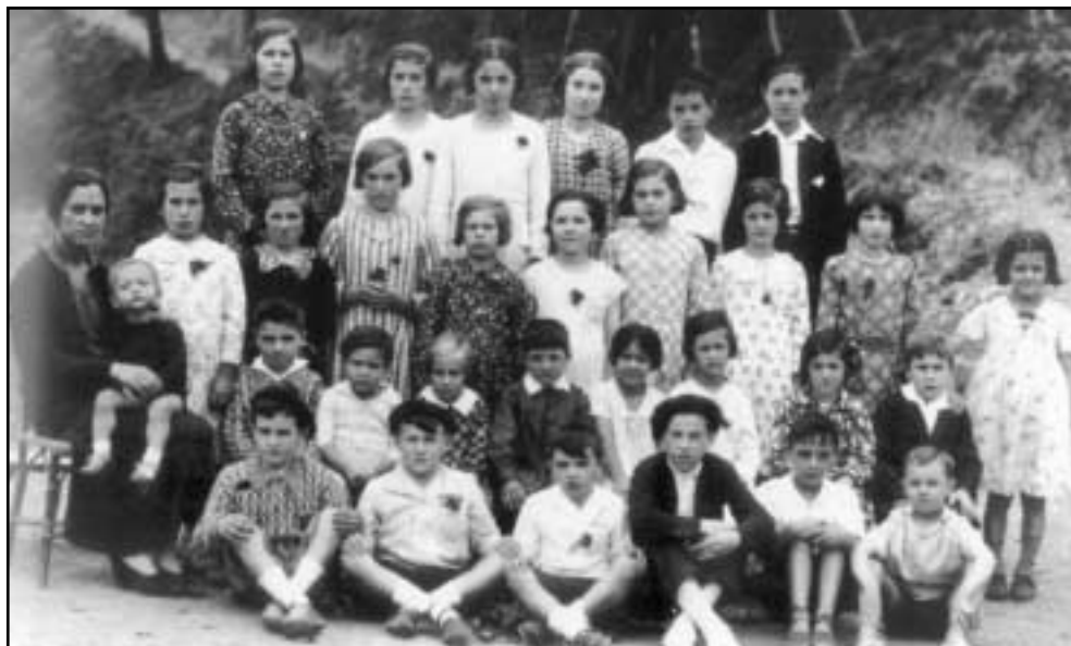
Aiastia (San Migel) auzoan hartutako irudia, 1935 urtean.

Gaur egungo egoerarekin zerikusi handirik ez badu ere, sasoi haietan ere egoten ziren modak. Horrela bada, ile luzea izaten zen gizonezkoek emakumeengan gehien estimatzen zutena. Horregatik, emakumeek nahikoa izaten zuten, noizean behin, ilearen puntak eta bekokiko ilea moztearekin. Hala ere, bazegoen ile motza eramatea nahiago zuenik. Ia beti, emakumea bera edo hurbileko senideren bat izaten ziren ilea konpontzen aritzen zirenak.