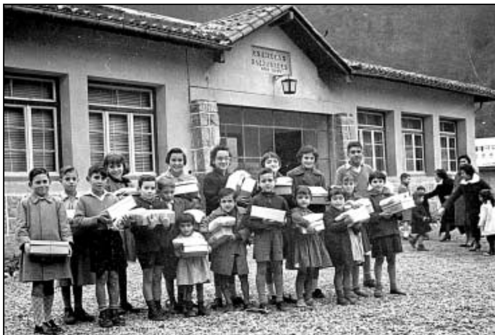
Umeak, opariak eskuetan hartuta, Altzolako eskolaren atarian.

Gure herriko eskoletan, irakaskuntzan jardun zuten ia maisu-maistra guztiak kanpotarrak ziren. Gehienetan, Euskal Herriko hainbat herritatik etortzen ziren. Hala ere, bakarren batzuk espainiar estatuko beste erkidego batzuetatik etorri ziren: Gaztela-Leon, Kantabria edo Asturias, esaterako. Zer esanik ez, gerra ostean, irakaskuntzan erabiltzen zen hizkuntza bakarra gaztelania zen.