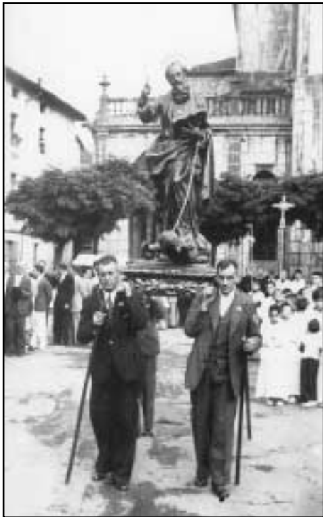
San Bartolome eguneko prozesioa. 1946 urtea.