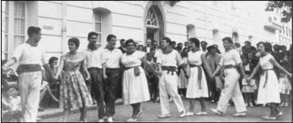
Zenbait gazte Altzolako bainuetxearen ondoan dantzan, San Juan jai batzuetan.

Hala ere, guk uste duguna kontuan izan gabe, gure aitonak oso gustura ibiltzen ziren laguntzaile lanetan, hori bai, neska ez zen inoiz ere oso urruti bizi behar. Une haiek bakarrik egoteko aprobetxatzen zituzten; oso gaizki ikusia zegoen eta jende aurrean musukatzea, besarkatzea eta laztantzea. Jendearen arteko esamesak oso ohikoak zirenez, eta guztiek elkar ezagutzen zutenez, mutilak neskari etxera laguntzen zionean, aprobetxatu egiten zuten bakarrik egoteko; jendearen ahotan ibili nahi ez bazuten, behinik behin. Musu sutsu bat eta laztan batzuk nahikoa izaten ziren gazteak etxera pozarren itzultzeko.