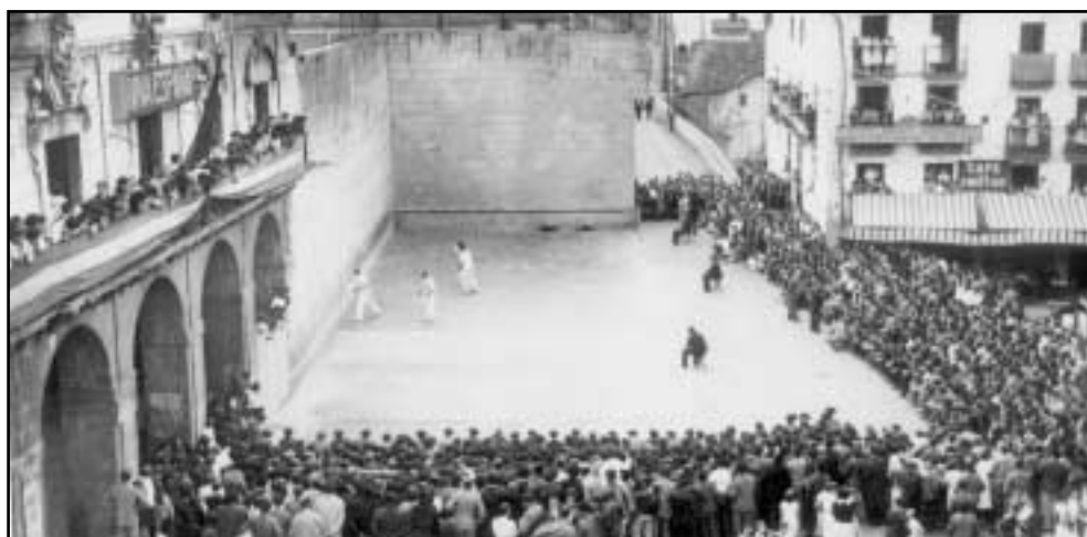
Jende ugari, herriko jaietan, Elgoibarko frontoian pilota partidu bat ikusten. 40ko hamarkada.