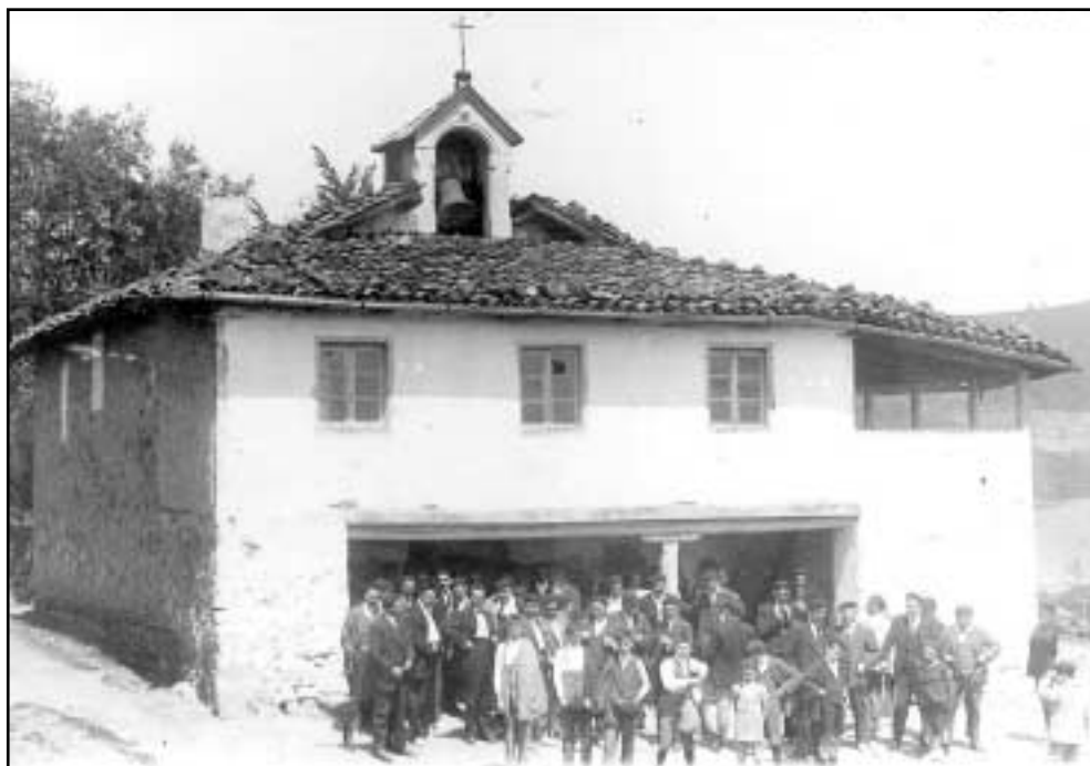
Baserri auzoetako biztanle guzti-guztiak auzoko basilizan egiten zen elizkizunera joaten ziren igandero. Aiaastia (San Migel), 1945 urtea.

Horretaz gain, elizgizonekin izandako harremanen ondorioz, desengainuak izan, eta elizan eta erlijio katolikoan jarrita zuen konfiantza galdu zutenak ere badira.