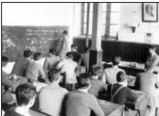
Gelan dagoen Diktadura garaiko ikasle talde baten ohiko irudia.

Garai hartako eskola dinamikak ez zeukan zer ikusirik gaur egungoarekin. Nahiz eta eskola ordutegia gaur egungoaren antzekoa izan, abuztuan eta Gabonetako nahiz Aste Santuko egun garrantzitsuetan bakarrik izaten zituzten oporrak.