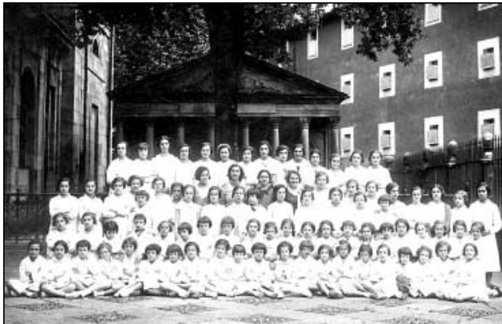
Eskola Publikoetako ikasleak Gernikako Arbola ikustera joan zireneko txangoa. 1933ko uztailearen 15a.

Eskolako irteerak eta txangoak ere bestelakoak izaten ziren. Noiz edo noiz, auzoetako eskola umeek irteeraren bat egiten zuten euren maisu-maistreakin batera. Gehienetan, ondo-ko mendiren batera joaten ziren.