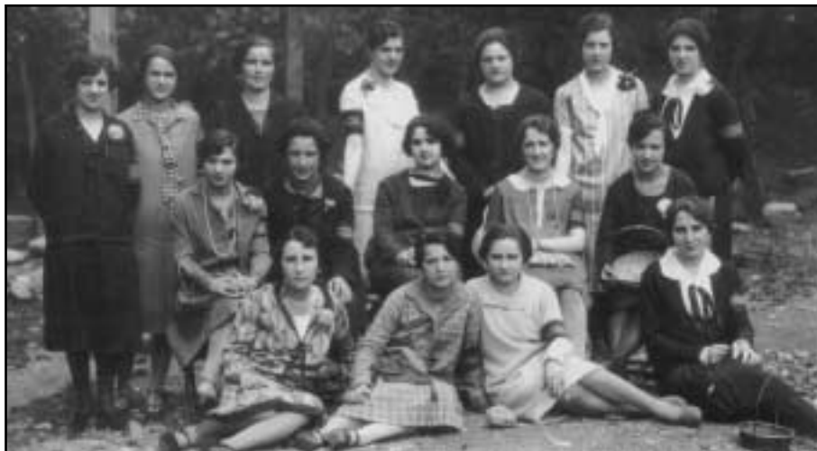
Gurutze Gorriaren aldeko diru-bilketa batean parte hartu zuten gazteak. Gutxi gorabehera 1920 urtea.

Gaur egun eta sasoi hartan, oso ohitura desberdinak zeuden eguzkia hartzearen inguruan. Gure aurrekoek ez zuten, gaur egun bezala, eguzkia hartzeko ohiturarik. Haientzat gerizpea zen eguzkiak zuen gauzarik hoberena. Gainera, azal zuria zen modan zegoena.