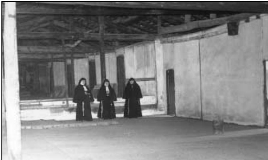
Santa Klara komentu zaharreko mojek klausura-botoa egiten zuten, eta ez ziren handik irteten.

Edonola ere, herritarrek oso begi onez ikusten zituzten mojek betetzen zituzten zereginak. Mojek bazuten pertsona bat herriko dendetan erosketak egin eta elgoibartarren lan eskaerak jasotzeko.