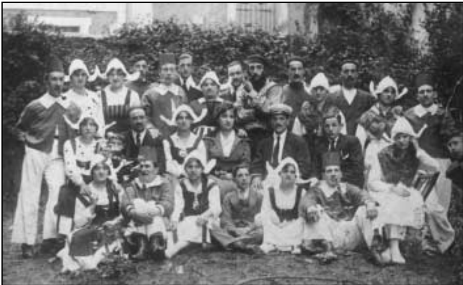
Joan den mendearen hasieratik hona, gure herrian izan dira antzerki talde afizionatuak.

Joan den mendearen bigarren erdialdean, Odeón zinema ireki zuten. Hura jauzi kualitativo garrantzitsua izan zen gure herrira iristen ziren ikuskizunen kalitateari zegokionean. Antzerkia eta zartzueta gisako jeneroak gure herriko karteldegian agertzen hasi ziren maiztasun jakin batekin. Elgoibartarrek pozarren hartu zituzten jenero berri horiek. Gainera, une hartako egoera ekonomikoa ona zen, bertako industria gorantz zihoan eta. Horrek eragin handia izan zuen, gure herritarrek konpainia profesionalak eskainitako kultura ikuskizunetara joan zitezten.