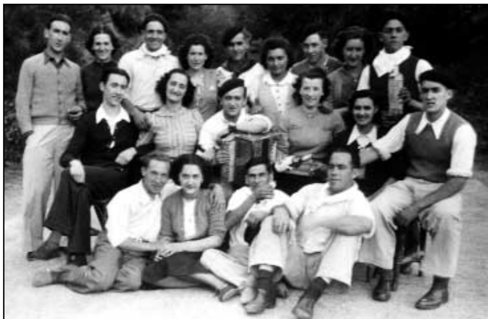
Elgoibarko koadrila bat, Aiastia (San Migel) auzoan. 1941 urtea.

Kaleko neska-mutikoez ere ezagutzen zuten elkar. Hori ez da harritzekoa, eskolatik irten ondoren, denbora libre asko izaten zutela kontuan izanez gero. Gehienetan, kalean, lagunekin jolasean igarotzen zituzten ordu haiek. Salto eta korri egiteko jolas ugari egiten zituzten, hala nola, "zaku karrera, pañuelo karrera edo bote-bote". Mendi irteerak ere ohikoak ziren. Herri inguruko mendietara, Morura, Morkaikora edo Kalamuara, joaten ziren; batez ere, eguraldi ona egiten hasten zenean.