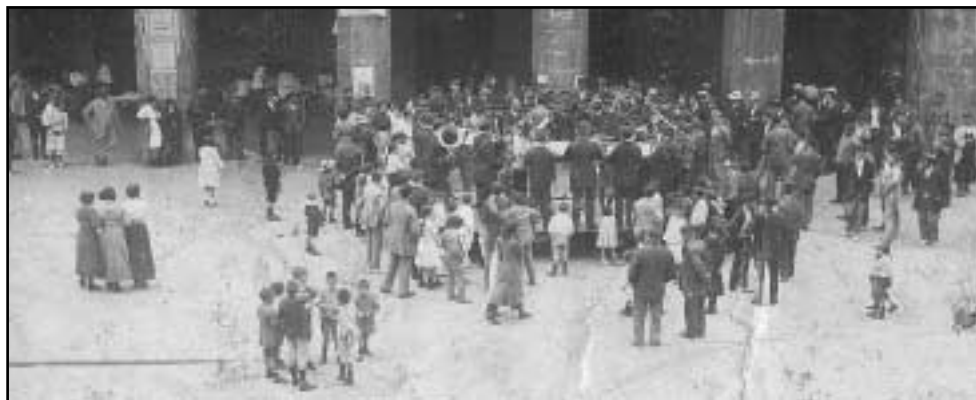
Udal Musika Bandak Foruen plazan eskaintzen zuen dantzaldia toki egokia izaten zen bikotea aurkitzeko.

Pozik itzultzen ziren denak etxera, neskaren bat begiz jo, eta harekin dantza egitea lortuz gero; hura zen eta andregaiak aurkitu ahal izateko eman beharreko lehenengo pausua. Baina sasoi hartan, dena oso motel joaten zen. Eguneroko zereginen ondorioz, hurrengo igandera arte ezin izaten zuten pertsona ezagutu berri hura ikusi. Elkar ikusten zutenean, gehienetan, gizona hurbiltzen zen gogoko zuen neskarengana. Elkar ezagutu nahi izanez gero, ausardia izan eta hasierako elkarrizketei ekin behar; hori baitzen harreman bat hasteko modua. Behin baino gehiagotan elkarrekin dantza egitea "zerbait gehiago egon" zitekeenaren seinale zen.