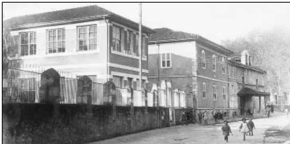
Maialako eskola zaharra. Dagoeneko, desagertuta dago.