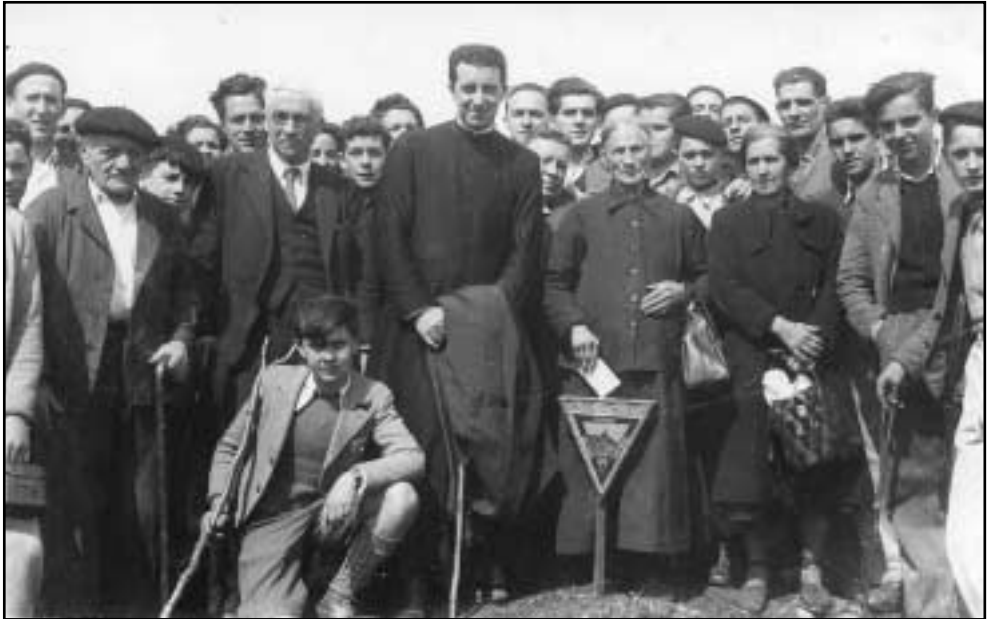
Morkaiko mendiko gutunontziaren inaugurazioa. 1944 urtea.

Baltasar pilotazaleen elkarte (1958) edo Gure Bide txirrindulari elkarte (1959). Elkarte horiek egindako lan eskuzabalari esker, bultzada handia izan zuen kirolarekiko zaletasunak herritarren artean.