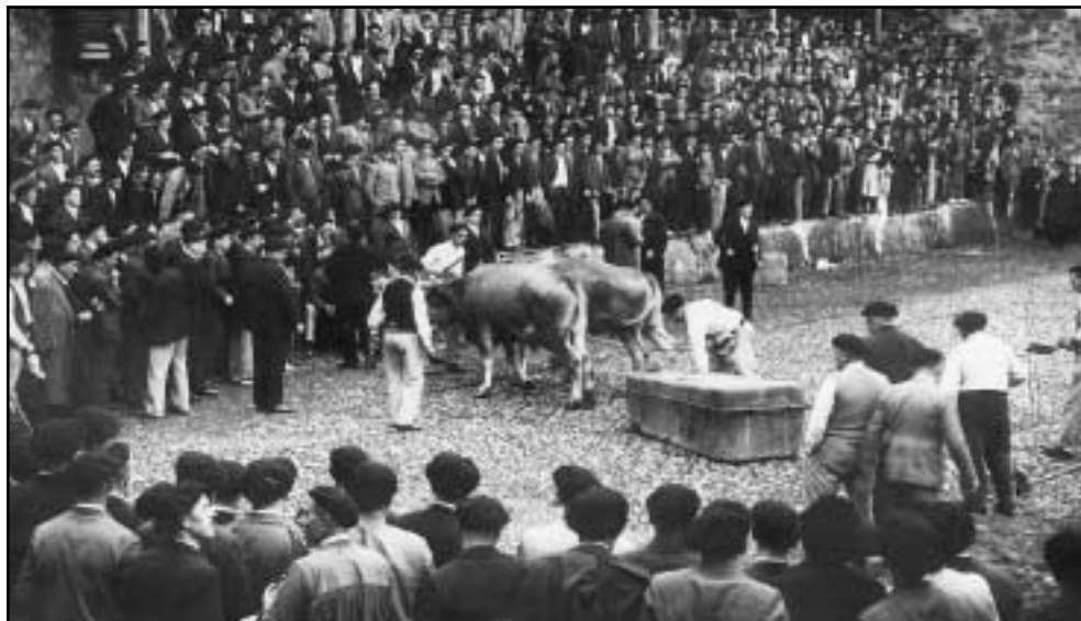
Gure herrian, idi proben inguruan, jende ugari bildu izan da betidanik.

Pilotazaleak, egunero-egunero, lana amaitu ondoren, herriko frontoiren batean elkartzen ziren, pilota partidak jokatzeko. Partida haietan nabarmena izaten zen jokalarien arteko lehia. Sarri-sarri, Kamiñerokuako (gaur egun desagertuta dago) eta Sallobente-Ermuaraneko frontoietan jokatzeko ziren pilota partidak. Hala ere, Kalegoengoa (gaur egun Foruen plaza) zen herriko frontoirik garrantzitsuenak.