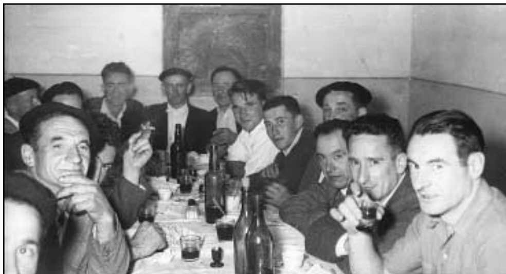
Gure herriko koadrilek edozein aukera aprobetxatzen zuten mahaiaren inguruan biltzeko.

Gehienetan, gure aitona-amonek sukaldean egiten zituzten jatordu haiek guztiak. Jangela, berriz, oso gutxitan erabiltzen zuten: jaietan edo senideen zein lagunengandik bisita izaten zutenean, esaterako.