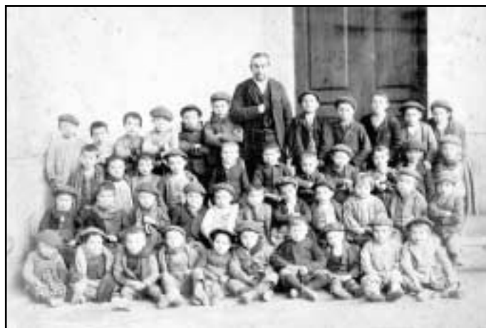
Ikasle talde bat, irakaslearen ondoan.