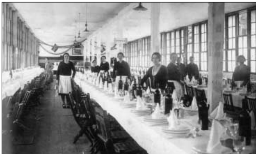
Altzolako bainuetzeko langileak, jangelan, bankete bat egin aurretik. 1933 urtea.

Jatordu haien guztien artetik, garrantzitsuena eguerdikoa izaten zen, bazkaria, alegia. Bazkaria desberdina izaten zen asteguna ala jaieguna izan. Izan ere, elgoibartarrek jaiegun gutxi izaten zituzten, eta asteko atsedena ondo merezia izaten zuten. Jaiegunetan, bada, bazkaria izaten gauzarik estimatuenetakoa.